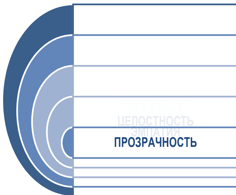
Рис 40. Пять универсальных принципов фандрайзера

Честность: фандрайзеры в любое время будут действовать честно и правдиво для сохранения общественного доверия и не введение доноров и клиентов в заблуждение.